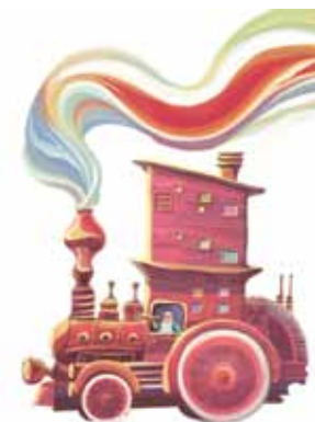
Ilustración: Ulises Alonso Sánchez

www.fundacion-sm.com • www.fundacion-sm.org.mx • www.elilustrado.com • www.fil.com.mx www.iberoamericailustra.com